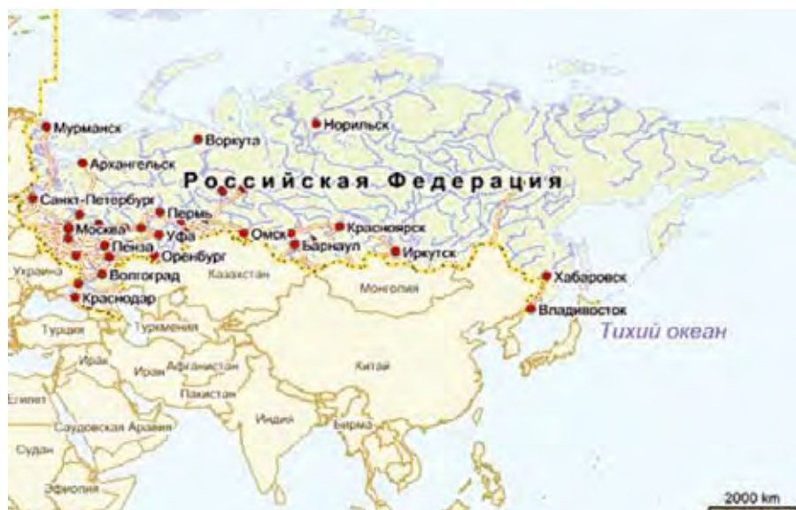
Крупнейшие городские агломерации России

территориальных уровнях административно-территориального управления. В постсоветское время в таком же ключе могла бы работать вертикаль документов территориального планирования при условии наличия ее верхнего звена – комплексной схемы пространственной организации обустройства территории Российской Федерации. Однако обеспечение согласованности отраслевых решений федерального уровня Градостроительным кодексом РФ не предусмотрено [4].