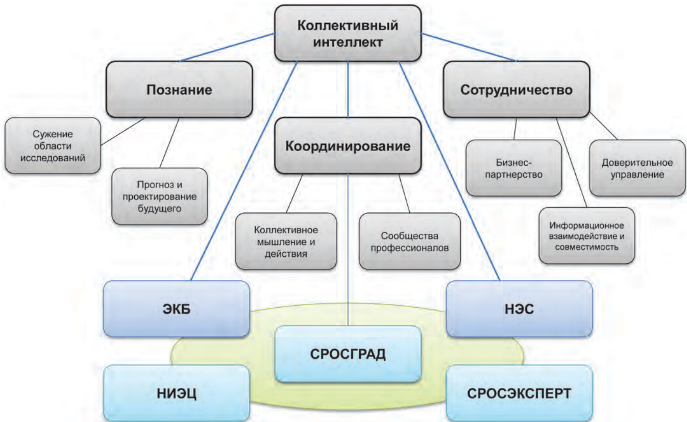
Рис.1. Виды и формы организации коллективного разума

СРОСЭКСПЕРТ — Экспертного сообщества градостроителей;