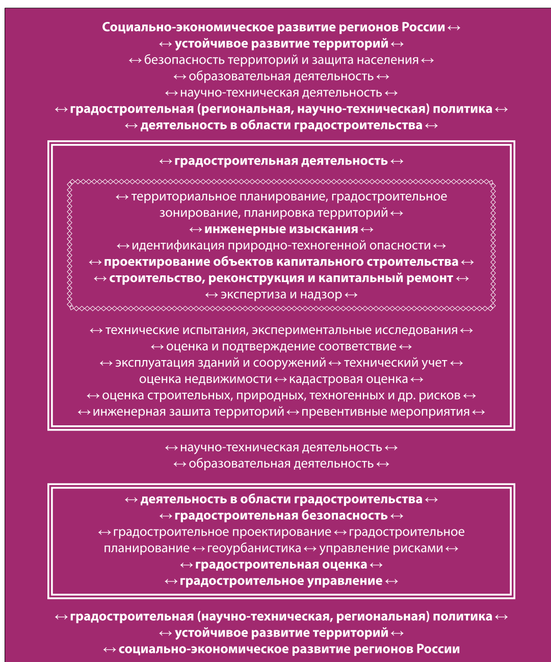
Рис.1. Взаимосвязь между отдельными направлениями профессиональной деятельности с позиций устойчивого развития

Кроме того, вопросы градостроительства тесно взаимосвязаны с оценочной, кадастровой, экспертной деятельностью, деятельностью в области обеспечения градостроительной, промышленной, экологической, энергетической, безопасности, которые должны решаться комплексно. А именно на уровне градостроительного проектирования закладываются основы устойчивости развития территорий - бе-