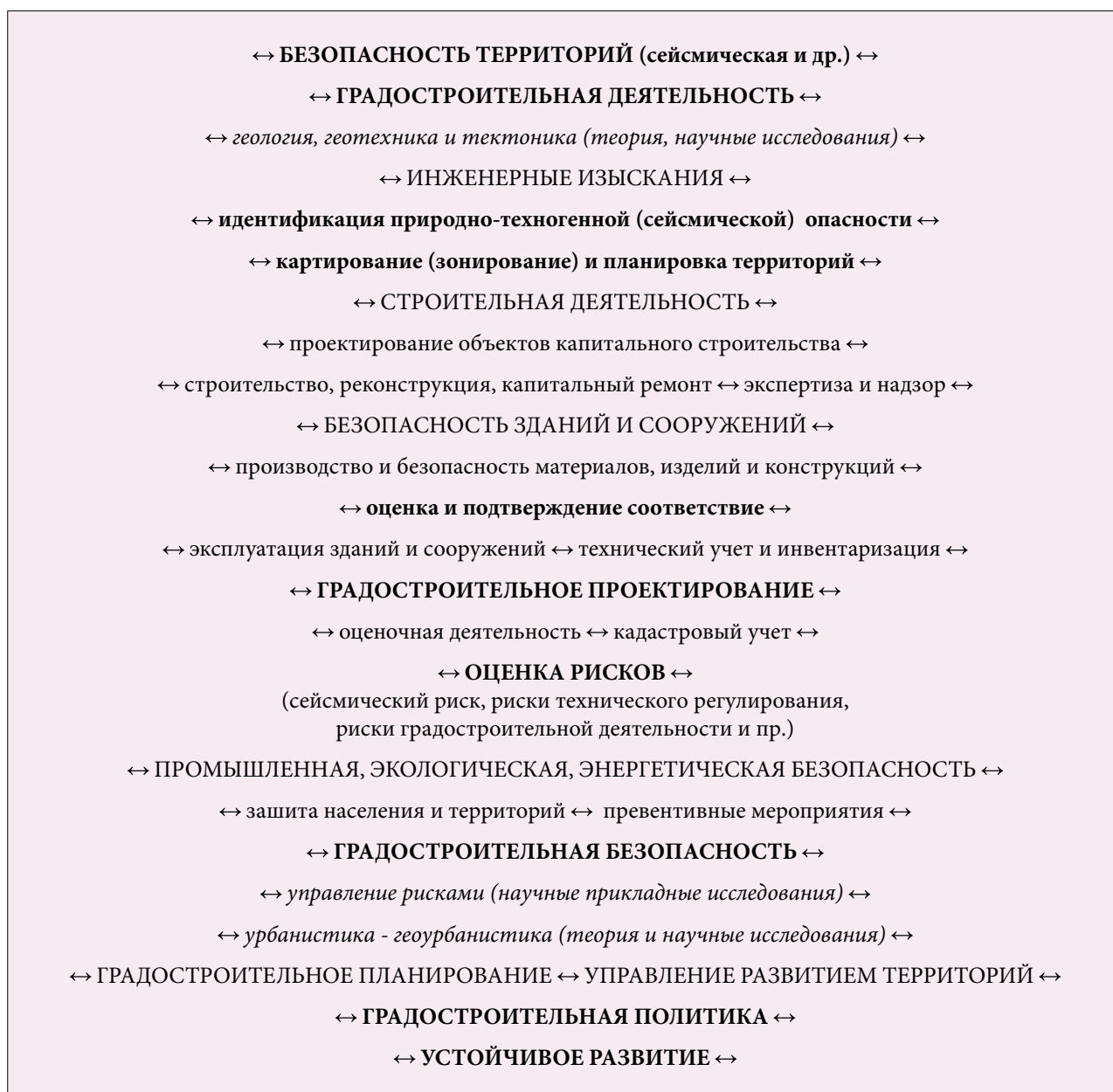
Рис.1. Схема взаимосвязей между градостроительными процессами

Устойчивое развитие напрямую связано с таким понятием как качество жизни граждан, в связи с чем, обеспечение безопасности территорий и управление