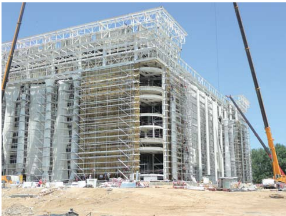
Рис.1. Дворец форумов «Узбекистан», Ташкент, Республика Узбекистан (НВФС «BWM ATK103/ATK 100 Minor»)