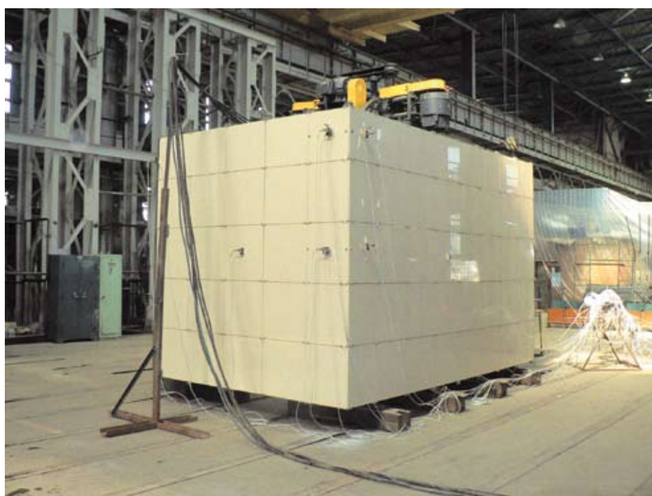
Рис.3. Вибростенд со смонтированной НВФС и источником вибраций (вибромашина инерционного действия (типа ВИД-12/08))

Вибростенд для динамических испытаний НВФС (рис.4) включает каркасную конструкцию 1, фундамент, выполненный в виде отдельных опор 2 или основания, один источник вибрации 4 и датчики (не показано), причем каркасная конструкция 1 включает вертикальные и горизонтальные связи 5, пересекающиеся в узлах 6 конструкции и одно перекрытие 7. Основание 3 может быть выполнено в виде монолитной плиты, либо рамной конструкции (условно не показаны).