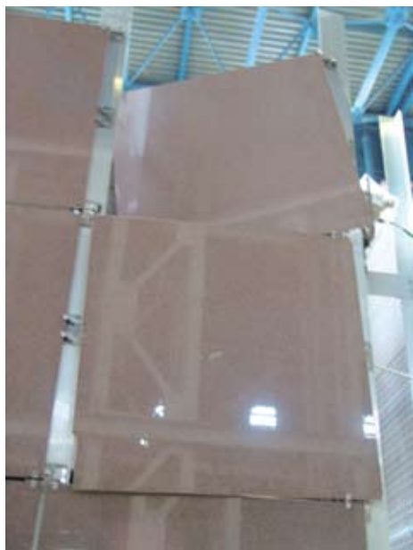
Рис.5. Характерные повреждения НВФС при динамических нагрузках (облицовка из керамогранитных плит)